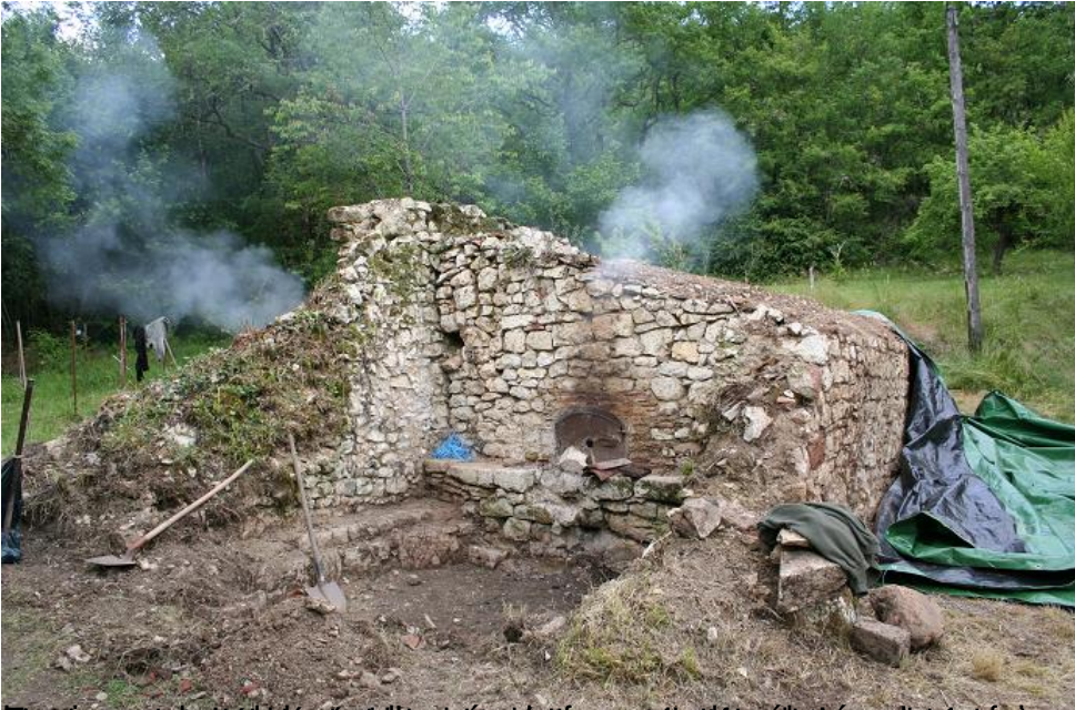
Le bâtiment est enfin dégagé et les fondations sont visibles. Les murs sont en pierre de taille et les toits en charpente.